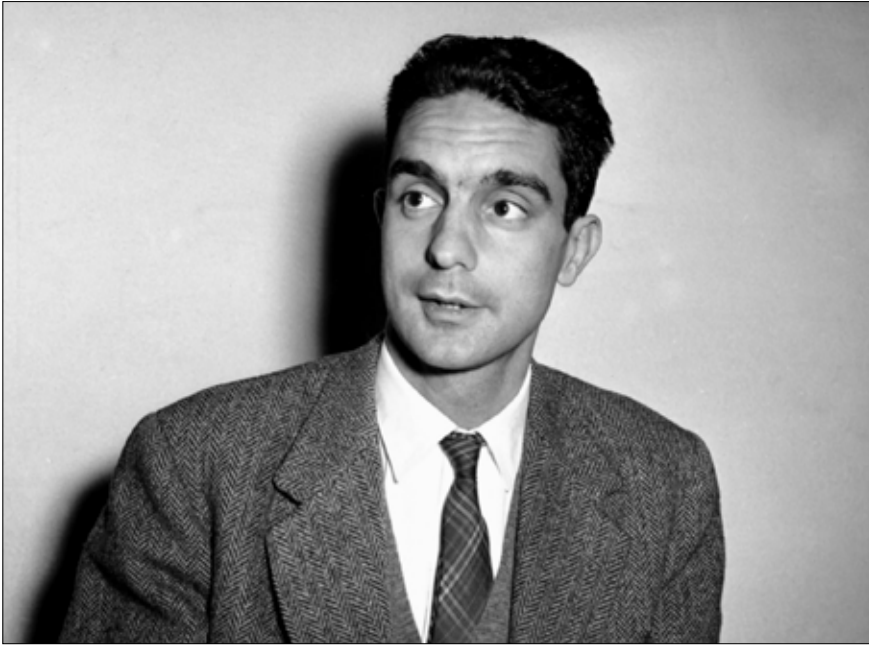
• ایتالو کالوینو (۱۹۲۳ - ۱۹۸۵م)

کنجکاوی آدم را جلب می‌کنند. مثلاً با عنوانی جذاب یا طرح جلدی هنرمندانه که نمی‌توان آن را نادیده گرفت. هجدمین گروه را سالها پیش خوانده‌ایم و اکنون احساس می‌کنیم باید دوباره آن‌ها را بخوانیم. نیاز به این بازخوانی معمولاً مربوط به تاثیری است که برخی از کتابها در زندگی ما می‌گذارند و گاه نقطه عطفی مهم محسوب می‌شوند. آخرین گروه شامل آثاری است که به تازگی منتشر شده‌اند و در یک کتابفروشی با جلدی درخشان خودنمایی می‌کنند. این طبقه خود بر اساس نویسنده و موضوع شامل چند بخشی فرعی است. مثل آثاری از نویسندگان جدید یا جدیدترین اثر یک نویسنده نامدار یا کتابی درباره موضوعی داغ و تازه. در نهایت شکلی از تازگی و طراوت در این گروه وجود دارد که آن را از طبقه‌های قبلی متمایز می‌کند. کالوینو در این زمینه می‌نویسد: «یک کتاب تازه منتشر شده، به تو نوعی لذت خاص می‌دهد، این فقط کتاب نیست که تو داری با خود می‌بری، بلکه تازگی آن است که فرقی با یک شی تازه از کارخانه درآمده ندارد. ... تو همیشه در آرزوی آشنایی با تازگی واقعی بوده‌ای که با یک بار تازه بودن همیشه تازه می‌ماند. اگر بی‌تحمیل یا تعقیب کتابی را به محض انتشار بخوانی در همان لحظه اول صاحب این تازگی شده‌ای». (ص. ۱۱). توصیف کاملتری از این موضوع را در یادداشت دیگری با همین عنوان نوشته‌ام که ۱۱ دی ۱۳۹۷ در سایت لیزنا منتشر شده است.